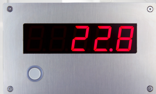
5x7 MESSWERTANZEIGE FÜR UNTERPUTZMONTAGE